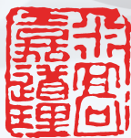
米高嘉道理爵士 香港，2023年2月

對於我們所發表的政策，董事會及本人將盡力切實遵循，以維護及提升股東的利益。我們將繼續監察及強化公司的企業管治政策，如本守則所載，確保有關實務和標準保持符合股東的期望。