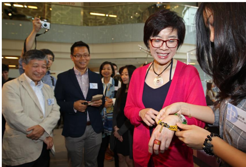
(圖二) (左起) 中華電力總裁潘偉賢先生、立法會議員陳恒鑞先生及中華電力企業發展總裁莊偉茵女士參觀「升級再造環保設計展」內「WEEE的家」，學生親身講解創作意念，分享如何善用舊電器零件升級再造。