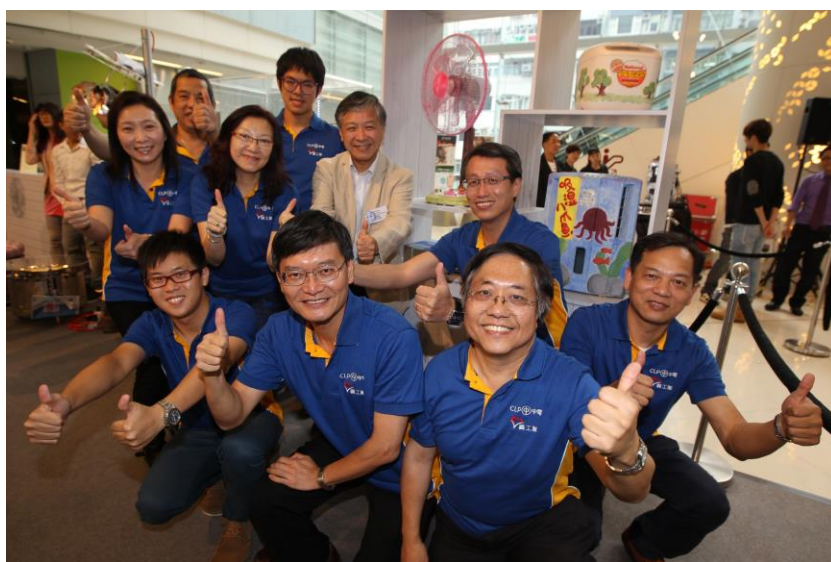
(圖三) 中華電力自2010年起與聖雅各福群會合辦「再生家電送關懷」計劃，回收市民棄置的舊家電，中電義工隊亦在公餘時間幫忙將維修後的電器送贈有需要的基層家庭。